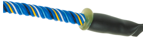
Câble détecteur FG-ECS côté terminaison